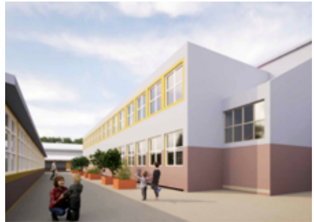
Propuesta de rehabilitación energética.

Este proceso integral no solo se centró en la infraestructura física, sino que también abarcó aspectos cruciales para optimizar el entorno educativo. Se buscó crear un ambiente propicio para el aprendizaje mediante la adecuación de las instalaciones, contribuyendo así al bienestar de estudiantes y docentes. Este compromiso con la mejora continua refleja la importancia atribuida al desarrollo educativo y al fortalecimiento de las condiciones que propician un aprendizaje efectivo y enriquecedor.