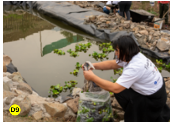
D1. Reunión con fundadores de la población Última Hora | D2. Movimientos de tierra en el terreno | D3. Resultado de la jornada de diseño participativo | D4. Recorrido participativo por terreno | D5. Vista aérea de la construcción del Parque Humedal La memoria de La Vertiente | D6. Jornada de diseño participativo en la sede vecinal de la población Última Hora | D7. Inauguración de la exposición “Sueño con un lago” | D8. Jornada de trabajo con voluntarios | D9. Construcción del humedal.