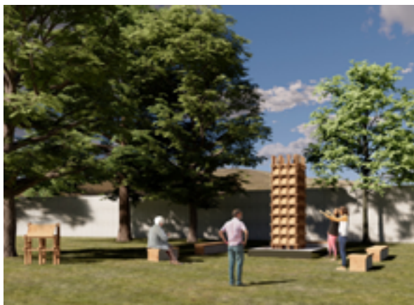
Imagen objetivo del memorial en el Museo.

Al mismo tiempo, brindamos apoyo a la Agrupación de Familiares de Detenidos Desaparecidos de Mulchén en distintas labores, principalmente en la continuidad de la mesa interinstitucional, donde participan el Mincap y la CONAF, apoyando en la revisión de documentos, la planificación y otras actividades. Sostuvimos varias reuniones en Collipulli y Santiago. Por último, iniciamos conversaciones con el alcalde de Mulchén para evaluar la posibilidad de que la municipalidad reciba la muestra museográfica que acompaña al memorial.