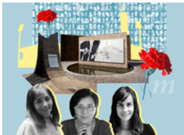
Causa Común, episodio 3.