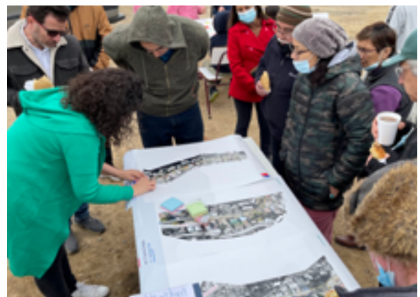
Actividades de participación en Valparaíso.