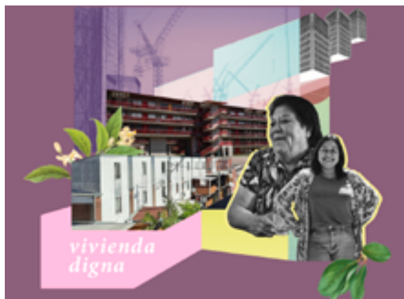
Causa Común, episodio 2.