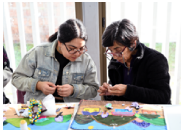
Taller de arpillera con adultas mayores.