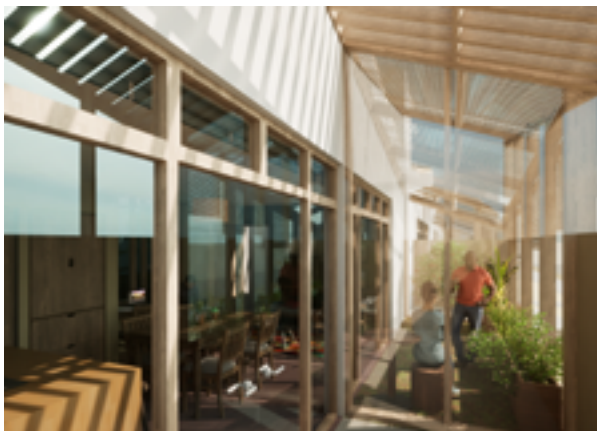
Render del espacio intermedio de la Casa Mixtura.

Participamos del concurso ModHabitar de CTEC para crear soluciones en el diseño, prototipado y pilotaje de un estándar de vivienda social para la Región de Antofagasta, convocando a la cadena de valor del sector (pymes), quienes serán acompañadas y capacitadas bajo un desafío común.