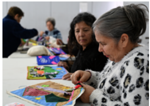
Taller de arpillera con adultas mayores.