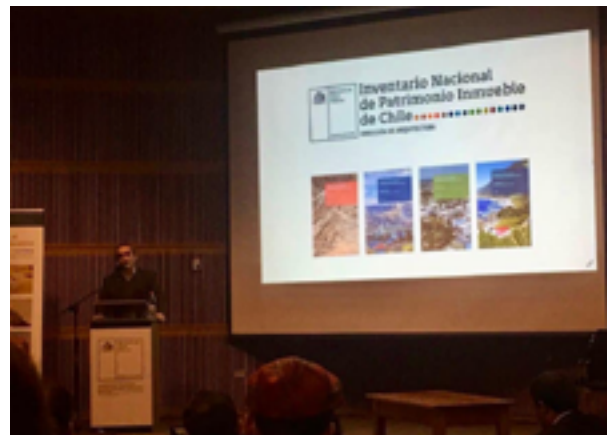
Lanzamiento de Inventarios Nacionales en Santiago.