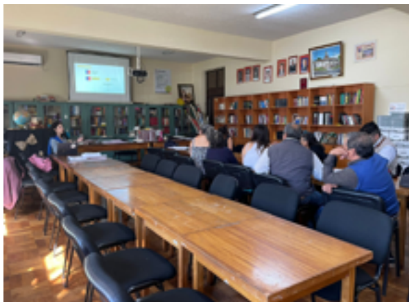
Presentación a la AFDD en la comuna de Mulchén.