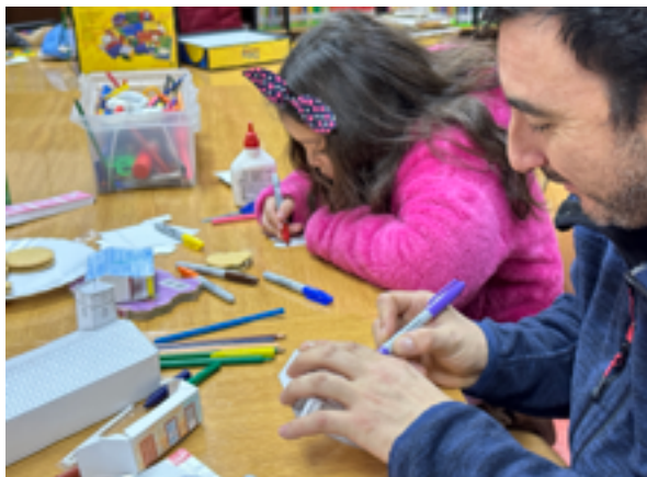
Jornada con niñas, niños y jóvenes.