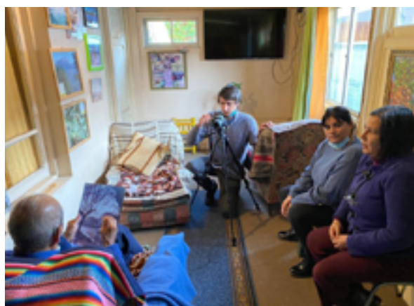
Entrevista a sobreviviente del terremoto de 1939.