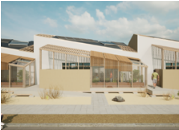
Render exterior de la Casa Mixtura.