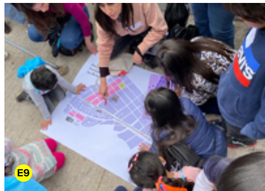
E1. Jornada de participación con la comunidad | E2. Maqueta de la población obrero ferroviaria de San Bernardo | E3. Foto histórica de la Maestranza San Bernardo | E4. Material didáctico para niñas y niños | E5. Exploración urbana con niñas y niños | E6. Foto grupal frente a la Maestranza San Bernardo | E7. Jornada de participación con vecinas | E8. Niñas de la población obrero ferroviaria | E9. Mapeo colectivo con niñas y niños.