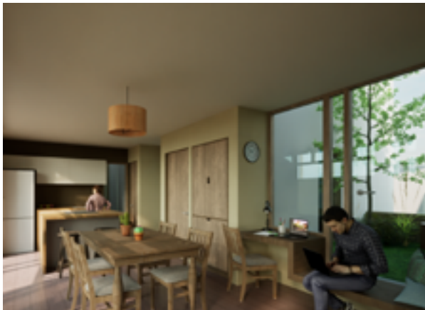
Render interior de la Casa Mixtura.