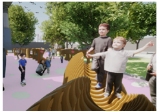
Imagen objetivo de la intervención.