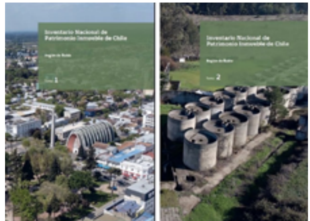
Tomo I y II del Inventario de Patrimonio Inmueble de Ñuble.

Las publicaciones se pueden descargar aquí .