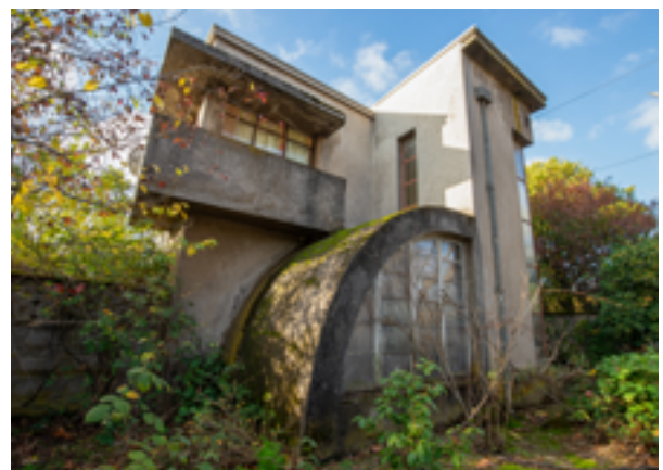
Casa Geométrica, comuna de Chillán.