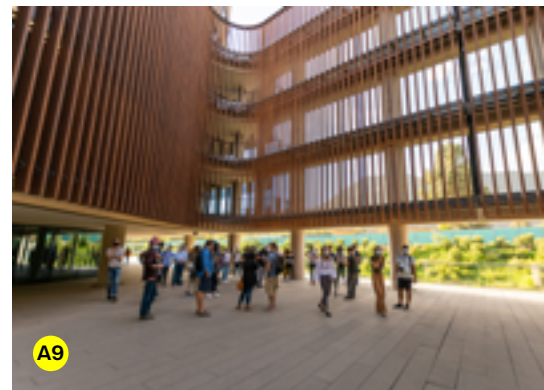
A1. Lanzamiento de OH! Stgo 2022 en el Centro Cultural La Moneda | A2. Memorial Escotilla N°8 del Estadio Nacional | A3. Condominio Justicia Social 1 en Recoleta | A4. Edificio ARYS | A5. Ruta patrimonial por el Barrio Yungay | A6. Taller Nubelab | A7. Ruta por el Cementerio General | A8. Los Bares son Patrimonio | A9. Edificio Tánica.