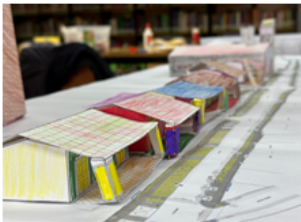
Maqueta de Yerbas Buenas.

Por último, fuimos parte de una gran caminata y cicletada familiar el sábado 2 de julio. Nos juntamos con los vecinos y vecinas en la plaza de Yerbas Buenas, donde hubo regalos y concursos.