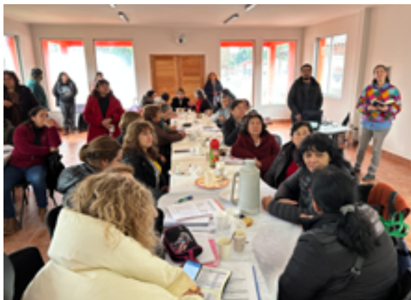
Actividad con jefas de hogar.