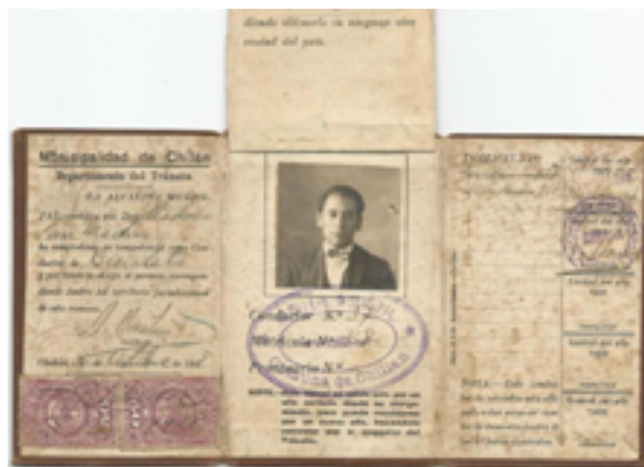
Licencia de conducir para bicicleta (1929).