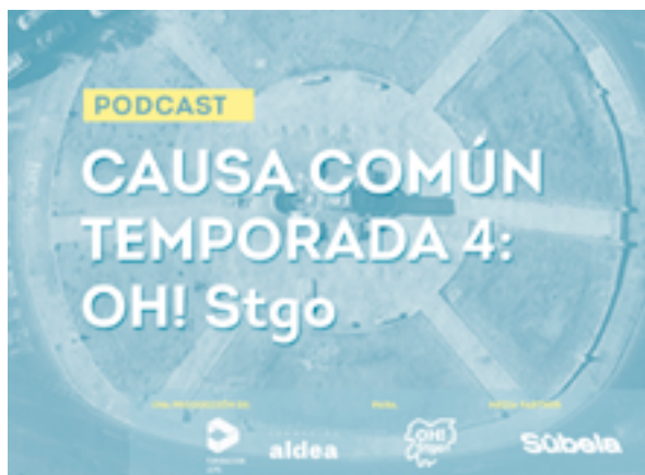
Temporada 4 del podcast Causa Común.