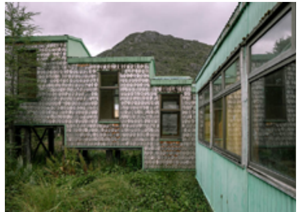
Escuela municipal cdte. Luis Bravo en Tortel, región de Aysén.