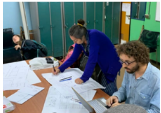
Equipo de levantamiento en terreno.