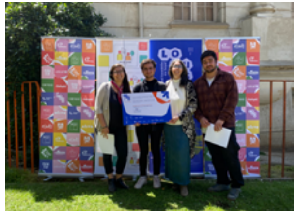
Reconocimiento en el Festival LOCUS.