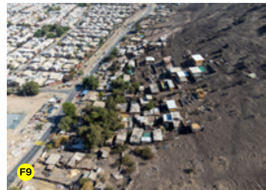
F1. Trabajos de mudanza | F2. Vista aérea de campamento deshabilitado | F3. Trabajos de retiro de escombros | F4. Trabajos en el campamento La Boza, comuna de Renca | F5. Trabajos de reciclaje de madera en Maipú | F6. Instalación de luminarias solares | F7. Instalación de luminarias solares en campamento de Andacollo | F8. Instalación de punto limpio en Coquimbo | F9. Vista aérea.